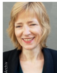
Literatur bei den Autorinnen

Auch das politische Mandat ist gegeben: mit dem Amsterdamer Vertrag der Europäischen Gemeinschaft (1999), aber auch national mit strategischen Vorgaben und gesetzliche Bestimmungen wie den Rahmengesundheitszielen, dem Bundeshaushaltsgesetz und dem Bundesfinanzgesetz – BFG, einer Empfehlung des Rechnungshofs sowie auf Landesebene etwa im Steirischen Gesundheitsfondsgesetz. Wenn die geschlechtergerechte Analyse und Praxis so evident erforderlich und zwingend ist, worauf beruhen dann die starken Widerstände, Verschleppungen und das „Nicht-einmal-Ignorieren“ in Österreich? Da sind zuerst einmal festgefahrene Traditionen und mangelnde Kompetenz, es anders zu machen als bisher. Da sind Interessengruppen und ihre Sorge um Machtverlust. Gründe genug, dass die Ungerechtigkeit noch andauert. Gründe genug für Veränderung. ::